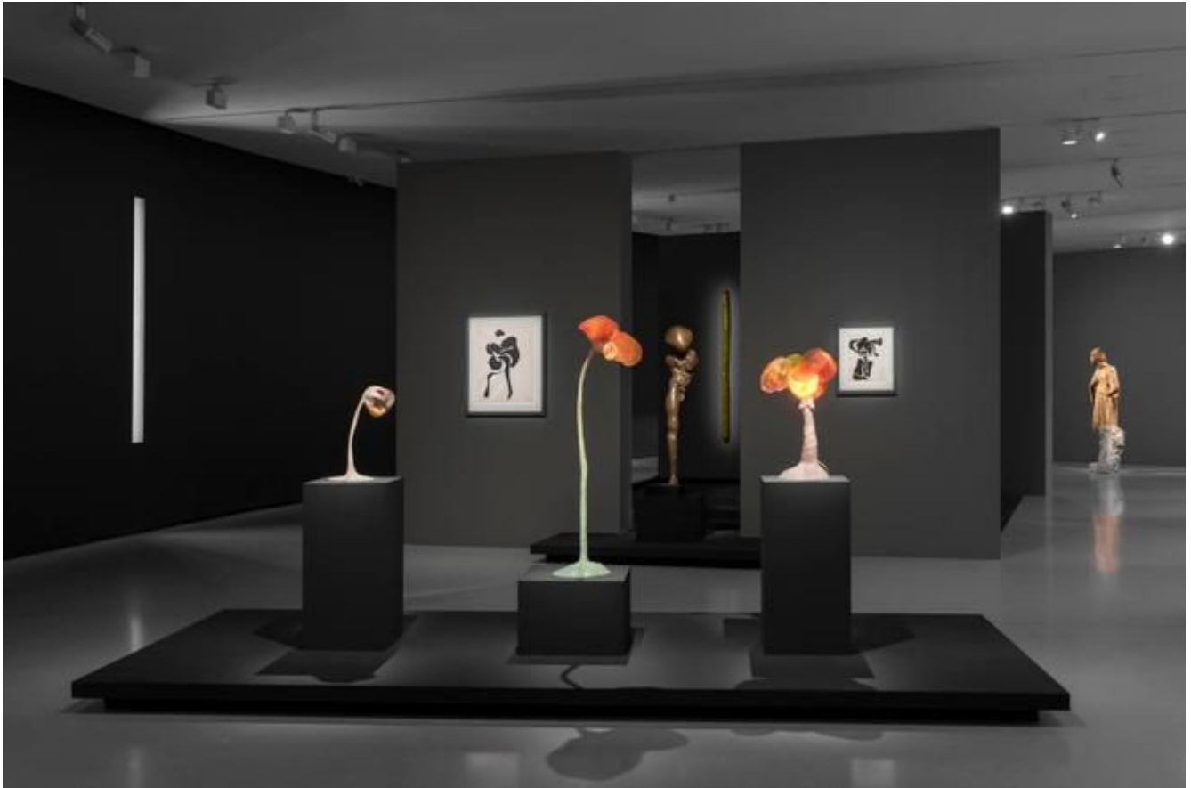
Alina Szapocznikow (1926-1973), Sculpture-lampe IX, 1970 Résine de polyester colorée, ampoule, câble d'alimentation

L'artiste polonaise Alina Szapocznikow (1926-1973) a fait l'expérience des camps de concentration et du cancer.