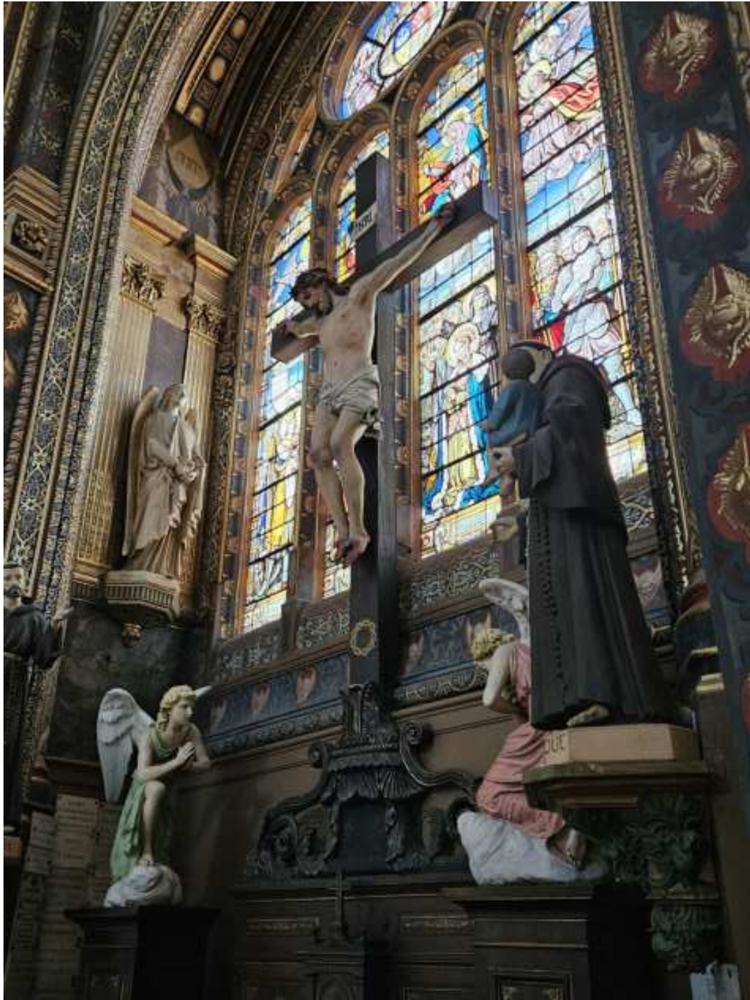
12- Le Christ en croix et deux anges , carton pierre peint au naturel, 19 e siècle, chapelle du Calvaire