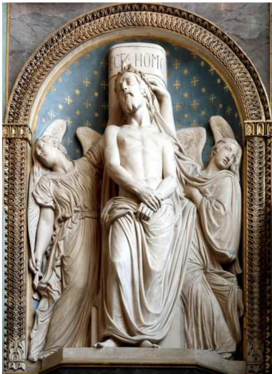
4- Antoine Etex (1808-1888), Ecce Homo (1857), sculpture en pierre, chapelle des âmes du Purgatoire, mur de gauche

Jésus donc sortit dehors, portant la couronne d'épines et le manteau pourpre. Et Pilate leur déclara : « Voici l'homme. » (Jean 19,5)