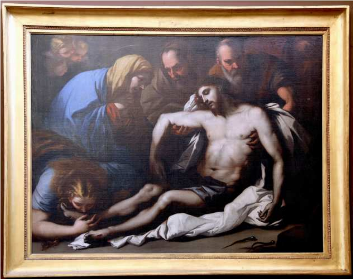
18- Luca Giordano (1634-1705), La Déploration sur le Christ mort (vers 1655-1660), chapelle Sainte-Agnès, paroi de gauche, au-dessus de l'autel