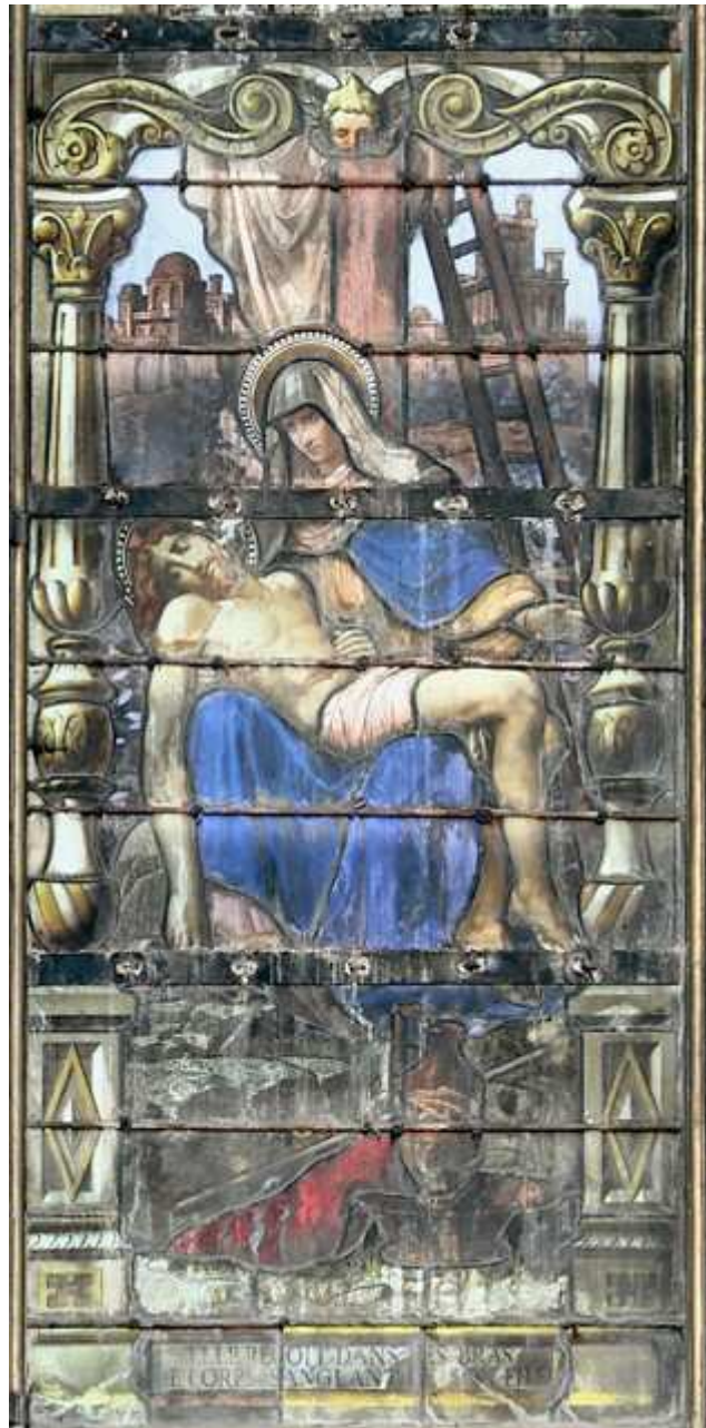
20- Charles Champigneulle (1820-1882), vitrail représentant Les Sept Douleurs de la Vierge , détail de La Pietà , chapelle Notre-Dame des Sept-Douleurs