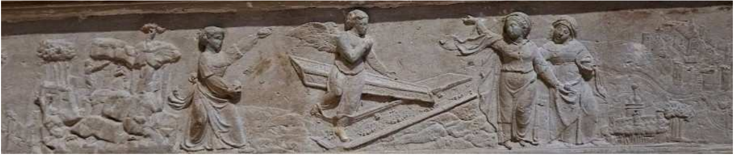
25- Les Saintes femmes au tombeau , école française du 16 e siècle, frise du soubassement, paroi de droite, transept Nord