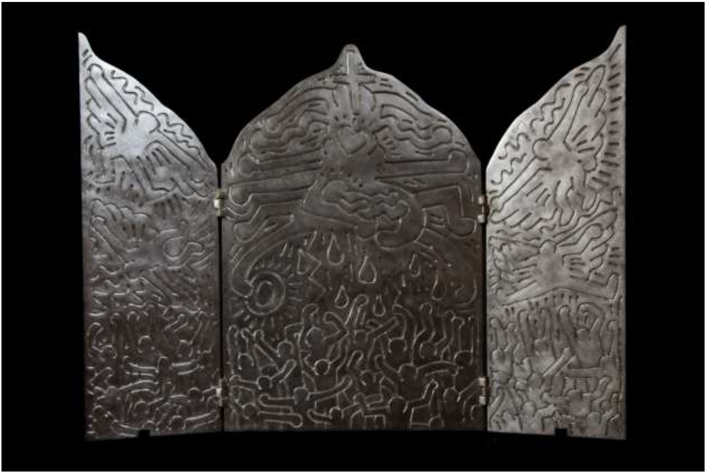
11- Keith Haring (1958-1990), La Vie du Christ (1990), triptyque en bronze recouvert d'or blanc, chapelle Saint-Vincent-de-Paul ( actuellement en travaux )