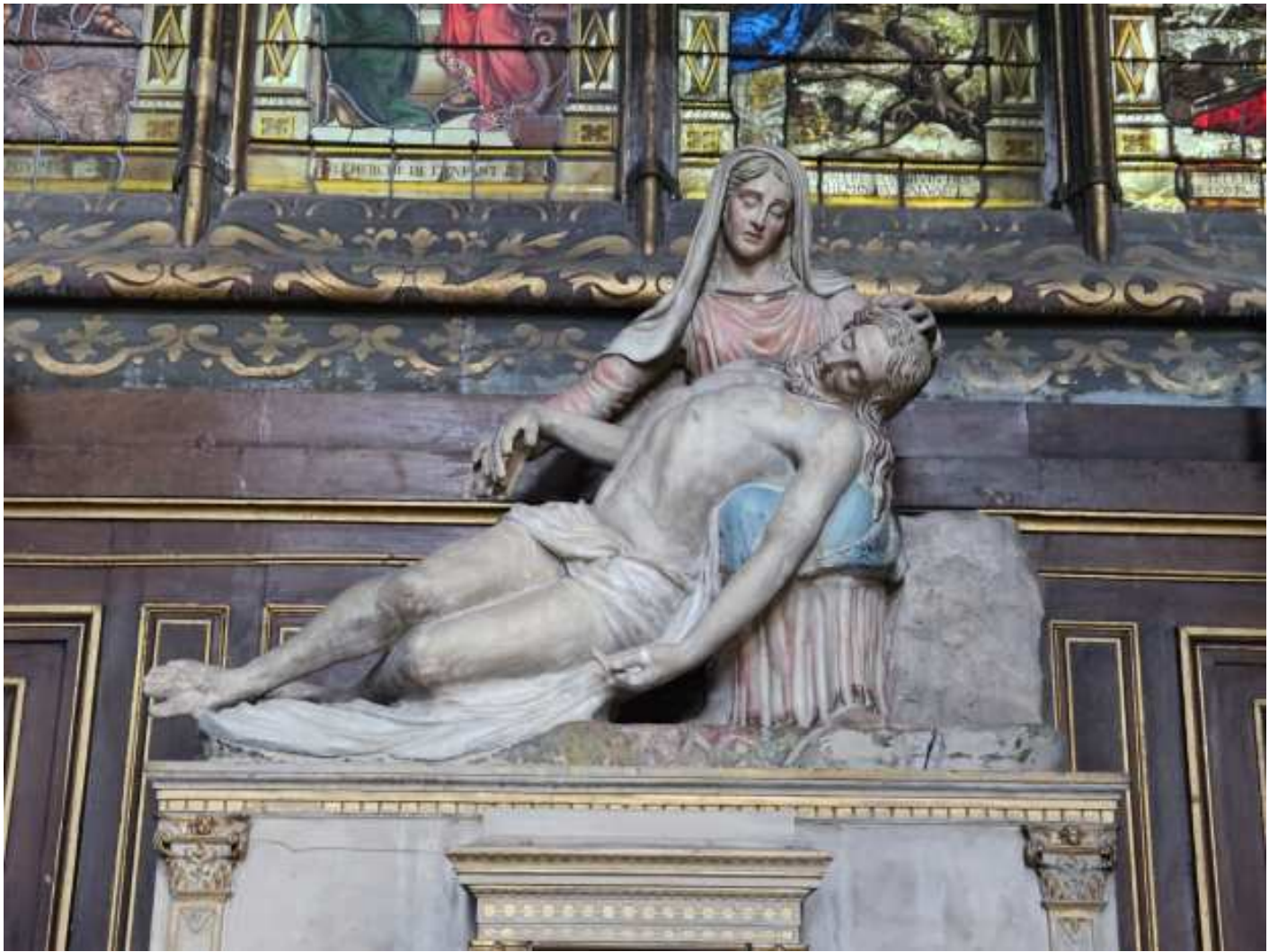
19- Statue en pierre de La Pietà , chapelle Notre-Dame des Sept-Douleurs