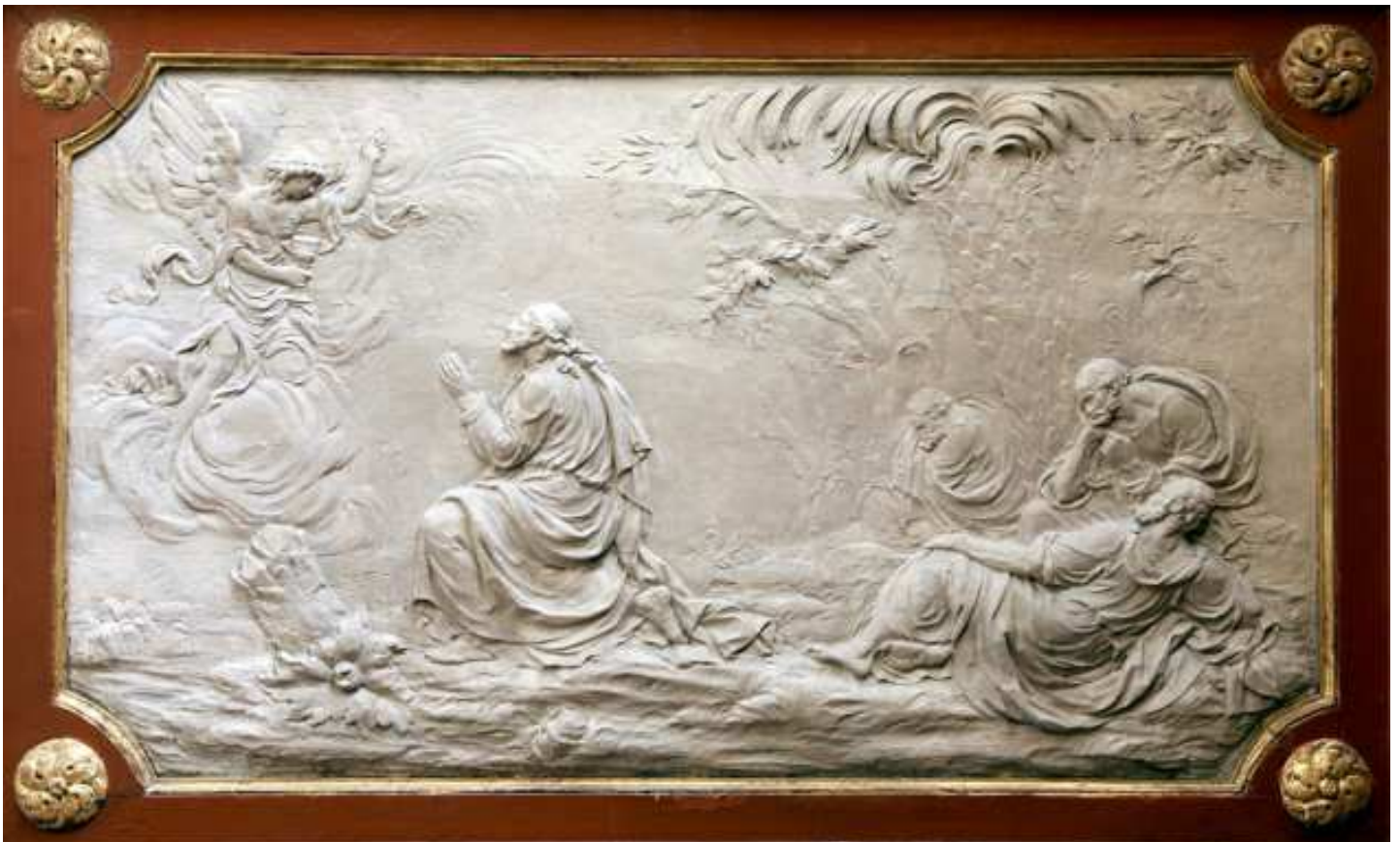
3- Le Christ au jardin des oliviers (relief), devant d'autel, chapelle des âmes du Purgatoire

Jésus sortit pour se rendre, selon son habitude, au mont des Oliviers, et ses disciples le suivirent. Arrivé en ce lieu, il leur dit : « Priez, pour ne pas entrer en tentation. » (...) S'étant mis à genoux, il priait en disant : « Père, si tu le veux, éloigne de moi cette coupe ; cependant, que soit faite non pas ma volonté, mais la tienne. » Alors, du ciel, lui apparut un ange qui le réconfortait. (...) Puis Jésus se releva de sa prière et rejoignit ses disciples qu'il trouva endormis, accablés de tristesse. (Luc 22,39-45)