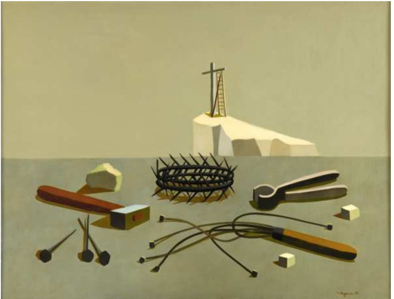
Vera Pagava, Les Instruments de la Passion , 1952, Huile sur toile, 88,5 x 116 cm. Courtesy Galerie Poggi, Paris / Association culturelle Vera Pagava - AC/VP. Œuvre insérée dans l'autel de célébration pendant le carême 2026