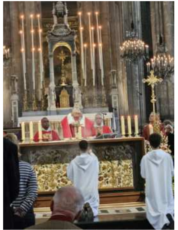
Consécration du pain et du vin