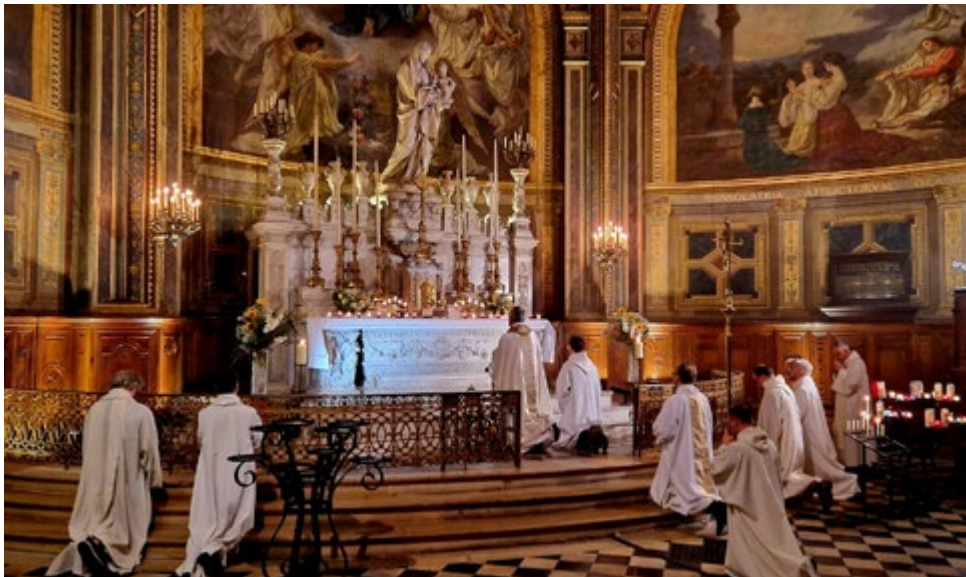
← La veillée du Jeudi saint au reposoir : l'un des temps forts du Triduum pascale chaque année à Saint-Eustache.

C'est cette lumière-là qui est confiée à celles et ceux qui célèbrent la Pâque du Seigneur pour qu'elle ne reste pas lettre morte mais soit, au contraire, ferment d'espérance pour le plus grand nombre !