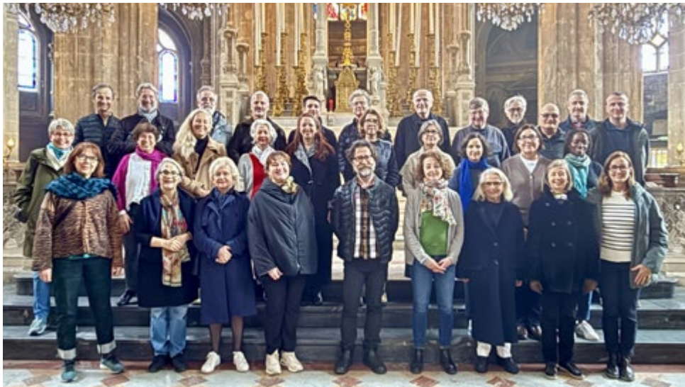
← Les Chanteurs de Saint-Eustache: 80 ans de fidélité à une paroisse dont ils ont enrichi la longue tradition musicale.