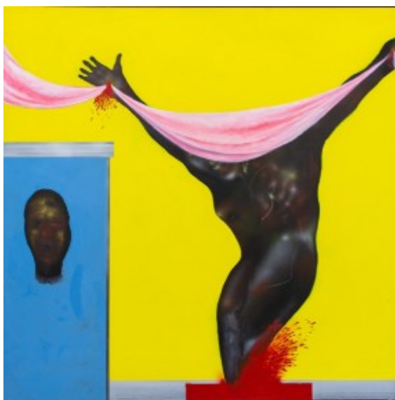
My Eden's pool de Pol Taburet

À ses côtés, un visage à plat, qui reprend le thème de la Sainte Face ou le Voile de Véronique. Mais la bouche est ouverte, les dents brillent de diamants, les grillz des rappeurs, et le visage se singularise par son nez rouge. Les références à l'art classique et contemporain sont multiples.