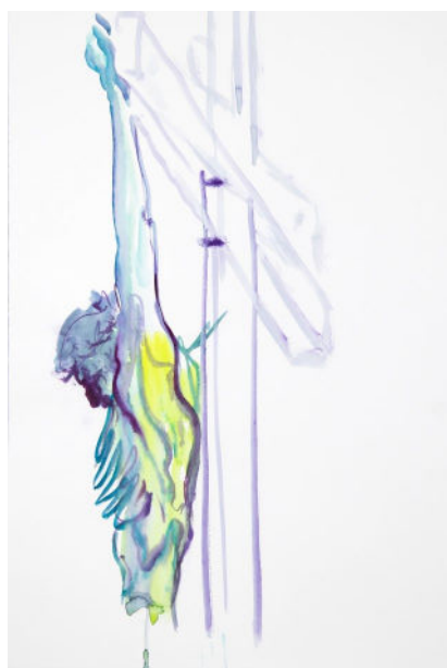
Esquisse pour un chemin de croix de Vincent Gicquel