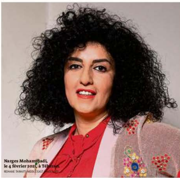
Narges Mohammadi, le 4 février 2021, à Téhéran.