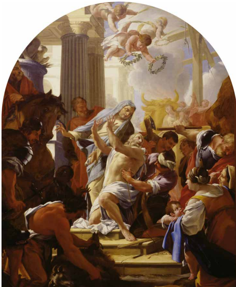
Simon Vouet (1590-1649), Le Martyre de Saint-Eustache .