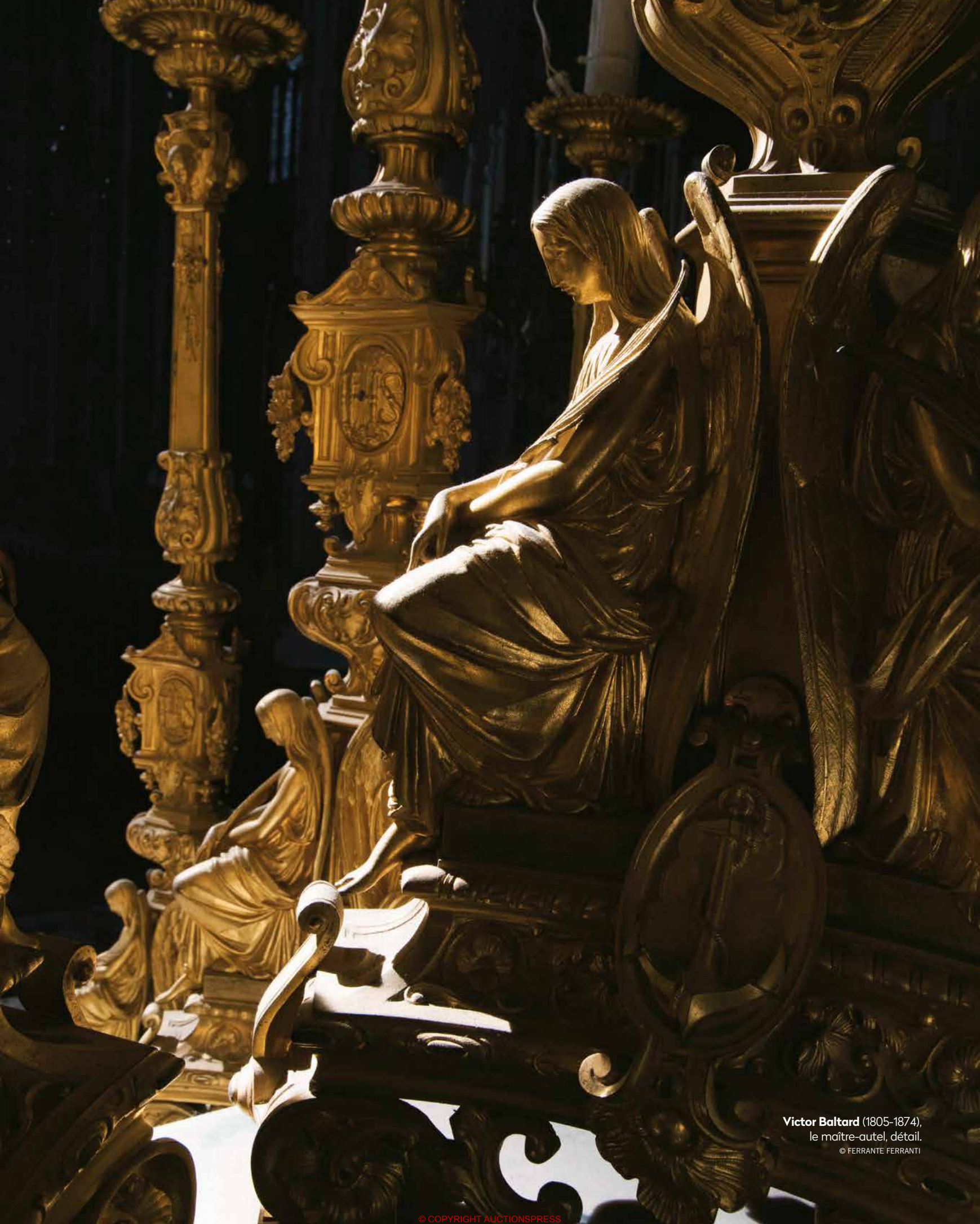
Victor Baltard (1805-1874), le maître-autel, détail.