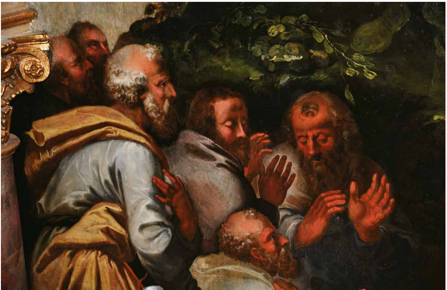
Anonyme, chapelle Saint-Joseph, L'Assomption de la Vierge , XVII e siècle, détail.

L'église se distingue par ses dimensions mais aussi et surtout par la richesse et la variété des