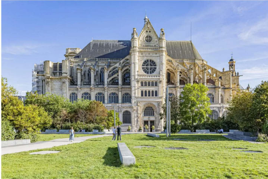
■ L'église Saint-Eustache à Paris, le 4 septembre 2023

Église emblématique de Paris, lieu de la première communion de Louis XIV ou du baptême de la marquise de Pompadour, Saint-Eustache fête ce week-end son 800e anniversaire avec une messe solennelle mais aussi diverses animations.