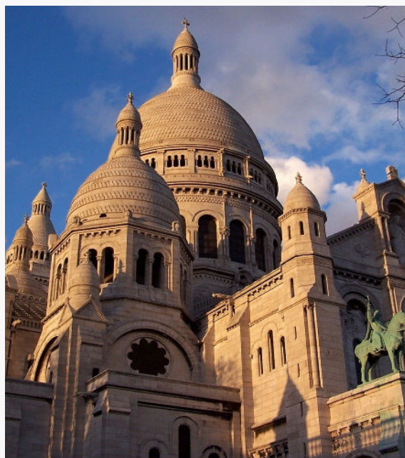
Basilique du Sacré-Cœur de Montmartre