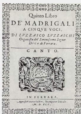
Le cinquième livre de madrigaux de Luzzasco Luzzaschi

Matteo Cesari, à la flûte L'ensemble les Métaboles L'ensemble Multilatérale Léo Warynski à la direction