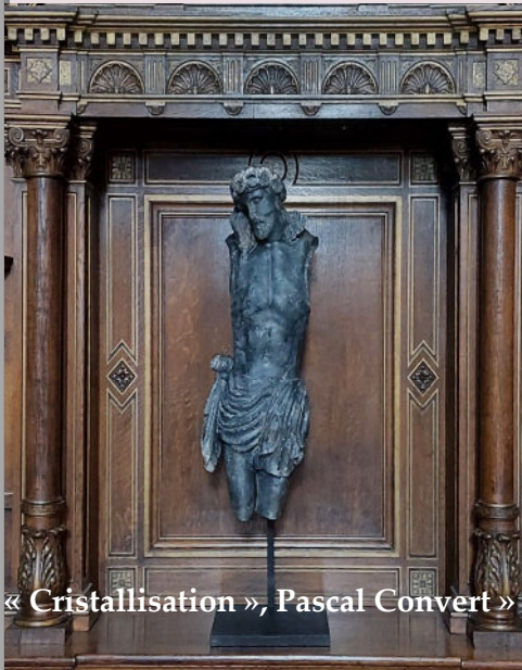
« Cristallisation », Pascal Convert »

« Jésus prit avec lui, Pierre, Jacques et Jean, et les emmena, eux seuls à l'écart sur une haute montagne, et il fut transfiguré devant eux », Evangile selon saint Marc 9-2, 10.