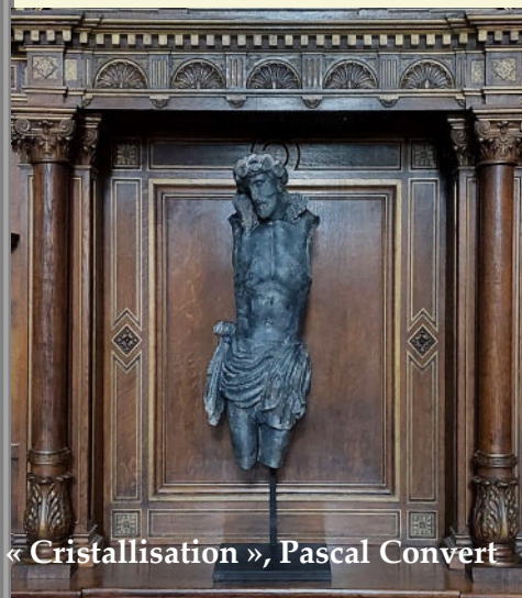
« Cristallisation », Pascal Convert

« Je vous laisse ma paix, je vous donne ma paix »