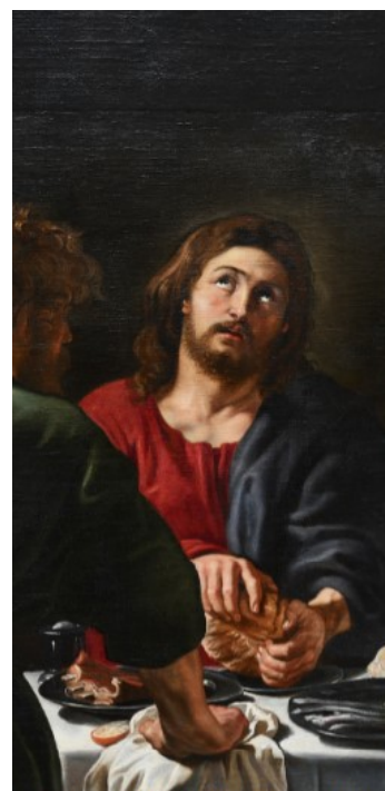
Les Pèlerins d'Emmaüs, Pierre-Paul Rubens

16h30 Messe de Pâques 16h30 (sur inscription)