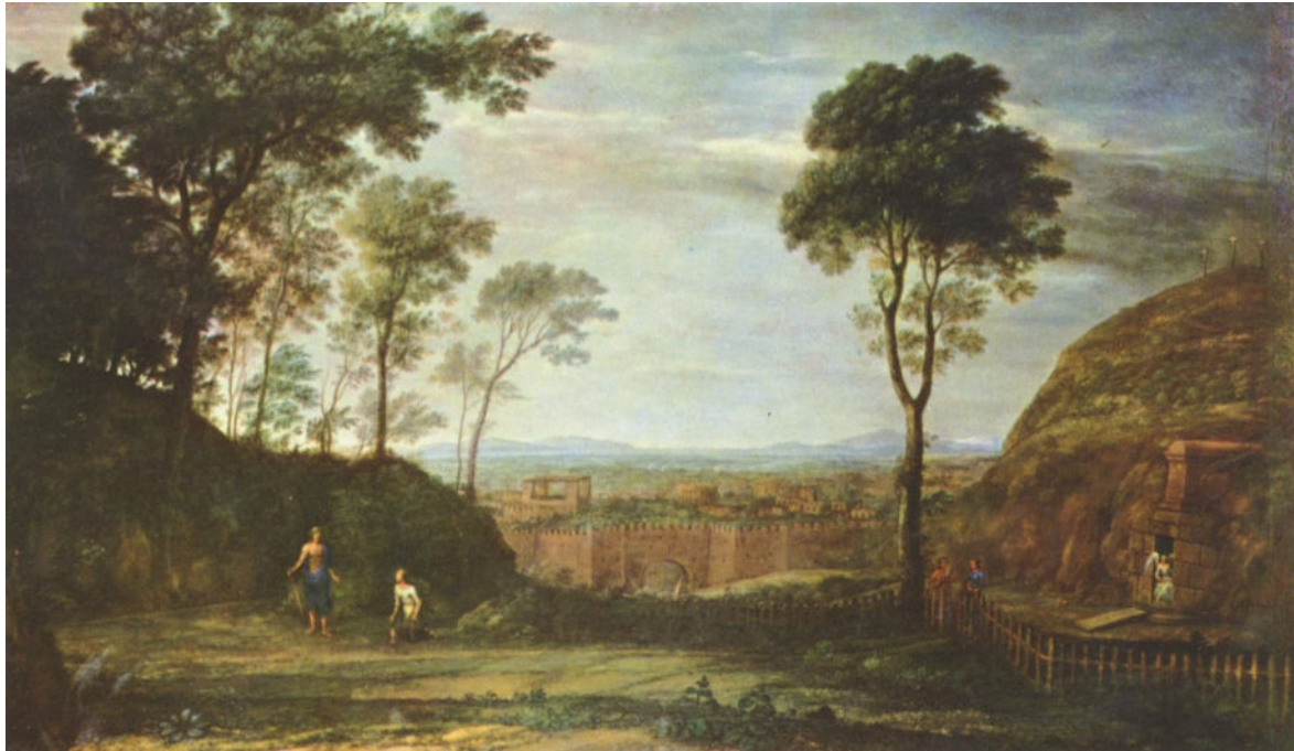
Claude Lorraine, « Le matin de Pâques »