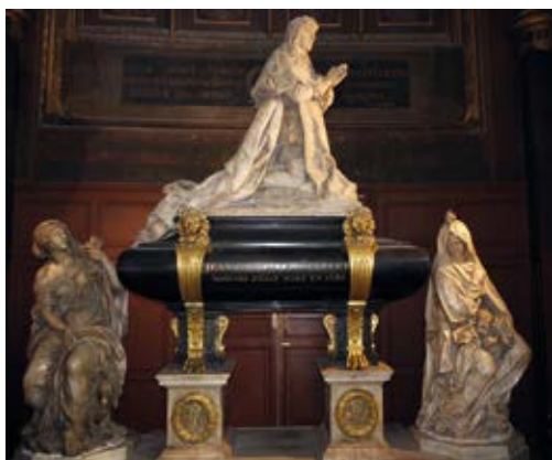
Ce monument est le mausolée du grand homme d'Etat Colbert, Ministre de l'Economie et des Finances de Louis XIV. La fonction est source d'importants revenus. Grand mécène des arts et des lettres, il est l'un des principaux bienfaiteurs de sa paroisse, en tant que marguillier (chargé des affaires économiques et de l'administration).

C'est aussi le panthéon des premiers membres de l'Académie Française et une trentaine y est enterrée. Parmi les plus célèbres, on peut citer : le poète Vincent Voiture; Antoine Furetière; Scaramouche, directeur de troupe, ami de Molière; également l'auteur de théâtre Marivaux.