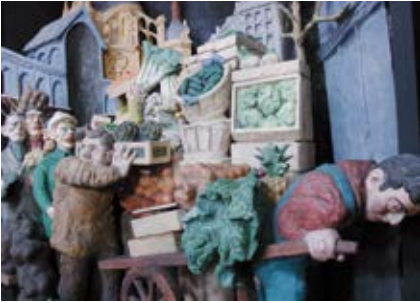
Départ des fruits et légumes du cœur de Paris (sculpture Raymond Mason)

Le commerce de gros qui alimente la capitale s'installe à partir du XII ème siècle autour du quartier connu aujourd'hui sous le nom des « Halles ». L'église accueille les corporations et confréries qui structurent les métiers des Halles.