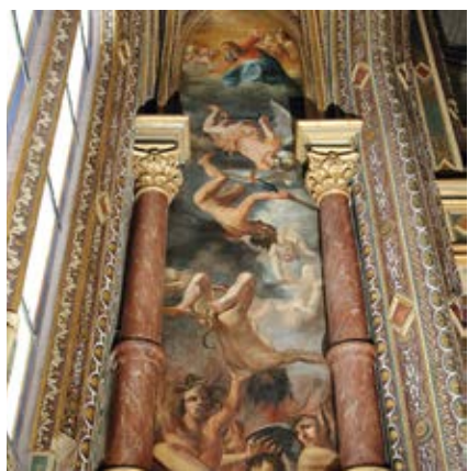
Chapelle des Saints Anges