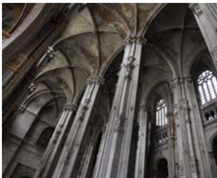
Détail d'architecture : ornementation Corinthienne

Le clergé paroissial et ses marguilliers se sont chargés du financement de la construction, grâce aux dons et revenus d'une paroisse royale, mais aussi avec le soutien d'importantes contributions : celles, au XVII ème siècle, du chancelier Pierre Séguier, du surintendant des finances Claude de Bullion, ou encore du ministre Jean-Baptiste Colbert.