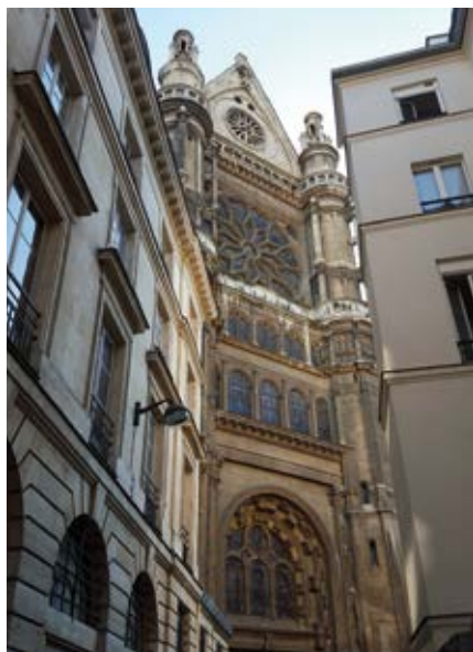
Vue du portail nord

de l'extérieur de l'édifice dérivent du modèle corinthien avec un goût prononcé pour l'ornement.