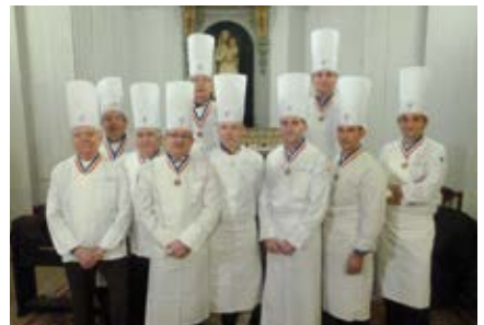
Chaque année, en novembre, se déroule dans l'église la « Messe du Souvenir des charcutiers » à laquelle se joignent d'autres métiers de bouche.

Paroisse de cultures et de fraternité, l'église Saint-Eustache est ouverte à toute la diversité de son environnement. Lieu de culte où l'on célèbre la liturgie et où l'on prie, c'est aussi, un lieu de partage et d'échanges ainsi que de rencontre humaine et culturelle, reconnu pour sa tradition musicale et sa sensibilité aux réalités de la vie sociale, avec notamment le soutien des commerçants et entreprises du quartier.