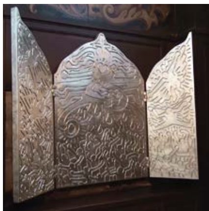
La Ville de Paris avait reçu le don du célèbre triptyque « La vie du Christ » de l'artiste américain Keith Haring. Elle l'a confié à la paroisse en hommage à son implication dans l'aide aux malades du SIDA.

incendie en 1844, l'architecte Victor Baltard, est chargé au nom de la Ville de Paris de la restauration de l'église. Outre la redécouverte des peintures du XVII ème siècle et leur remise en valeur, Baltard coordonne le travail de plus de trente peintres, sollicités entre 1849 et 1870 pour donner à l'église un décor théâtral et chatoyant.