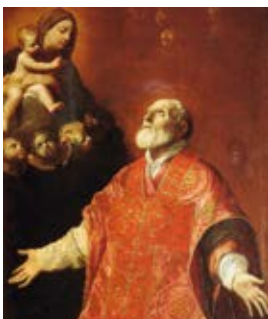
Guido Reni Saint Philippe Neri

L'Oratoire continue de creuser un sillon discret mais original dans la vie chrétienne française.