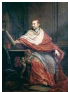
Ecole de Rigaud Cardinal de Berulle