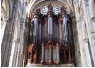
8000 tuyaux d'orgue enchassés dans un buffet dessiné par Baltard