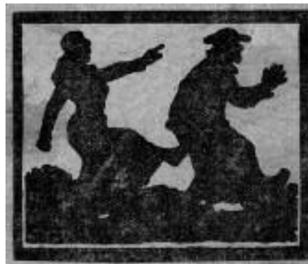
Affichette anti-cléricale datée de 1936, montrant la République française intimant à un religieux l'ordre de s'en aller.

Toute petite, elle s'est fait une promesse : aider les personnes qu'elle voyait faire la queue devant l'église Saint-Eustache, alors qu'elle revenait de déjeuner au restaurant, avec son grand-père qui habitait le quartier. Cette jeune femme non baptisée, qui se définit comme agnostique, a tenu parole, au point qu'elle a pris la responsabilité de la soupe du vendredi soir. Sa démarche est laïque : «Je